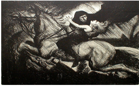
The Erlking 1910 Albert Stern